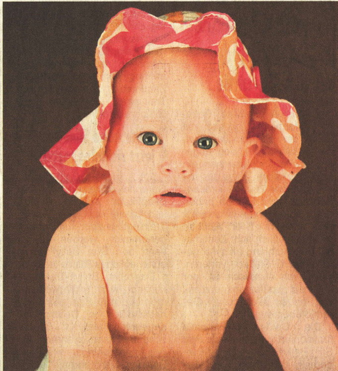
Die Familienmesse ist auch für Großeltern sicher interessant.

in der Klinik Mühldorf am Sonntag, 21.11. 2010 von 10 bis 16 Uhr